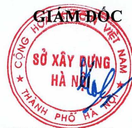
Võ Nguyên Phong