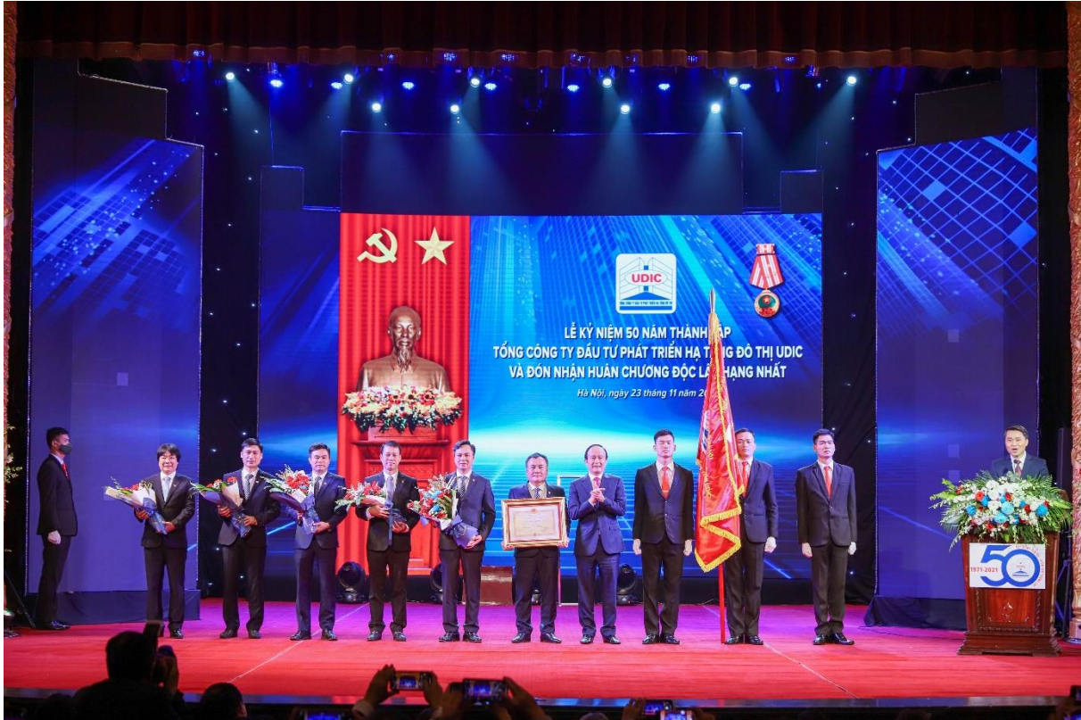
Lễ kỷ niệm 50 năm thành lập Tổng công ty và đón nhận Huân chương độc lập Hạng nhất năm 2021

Với những thành tích tiêu biểu đó, UDIC đã được Đảng, Nhà nước và Thành phố ghi nhận, biểu dương với nhiều danh hiệu, phần thưởng cao quý; Đặc biệt hơn cả, ngày 30/9/2021 Chủ tịch nước CHXHCN Việt Nam đã ký Quyết định số 1650/QĐ-CTN tặng thưởng Huân chương Độc lập hạng Nhất cho Tổng công ty là phần thưởng lớn lao trong suốt chặng đường 50 năm xây dựng và trưởng thành, đồng hành với sự phát triển của Ngành Xây dựng Thủ đô.