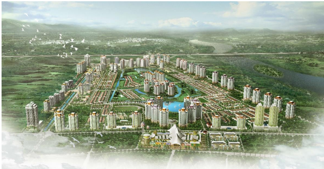
Khu đô thị Nam Thăng Long (Ciputra) - Tây Hồ - Hà Nội

Cùng với đó, UDIC còn đảm nhận vai trò Chủ đầu tư xây dựng nhiều dự án mang tính điểm nhấn tại Thủ đô Hà Nội như: khu đô thị mới Trung Yên, khu đô thị mới Yên Hoà, khu văn phòng và chung cư cao tầng 27 Huỳnh Thúc Kháng, khu nhà ở A - Nam Thành Công, Trung Yên Plaza, UDIC Complex, UDIC Riverside 1, UDIC Westlake, .... Các dự án này được triển khai có hiệu quả cao từ khâu giải phóng mặt bằng, thiết kế, thi công hạ tầng kỹ thuật, công trình ngầm đến thi công hoàn thiện đã góp phần tạo nên diện mạo mới cho Thủ đô về hạ tầng đô thị và đáp ứng nhu cầu nhà ở